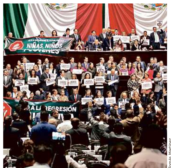
Legisladores de Oposición tomaron la tribuna de San Lázaro.

Sin embargo en su cuenta "personal" de Twitter insistió en que se sostenía en dicho elogio para los jóvenes.